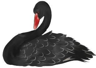
图 2: 竖排

图片竖排 \text{\LaTeX} 图片排版的逻辑是： 同一页面 下的图片根据引用顺序从上到下排列。图 2和图 3展示了图片 竖排 的效果。