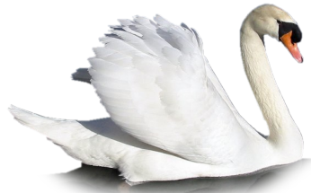
图 3: 竖排

图片并排 要实现并排的效果，可以有两种实现方式。一种是使用 子图 \text{\subfloat}[\{\}\{\} 命令，若子图的尺寸得当，即子图宽度和不超过行宽，默认左右排序，如图 4所示。