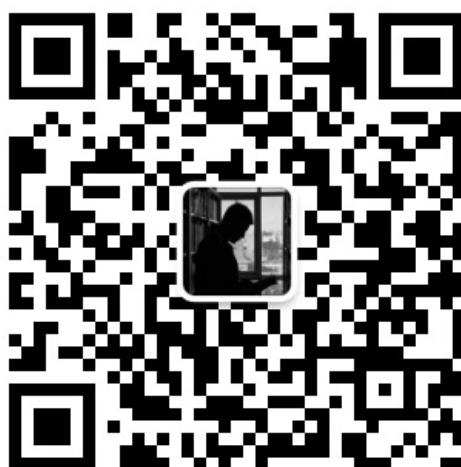
图 1: 关注公众号，获得大概也许可能的更新信息！