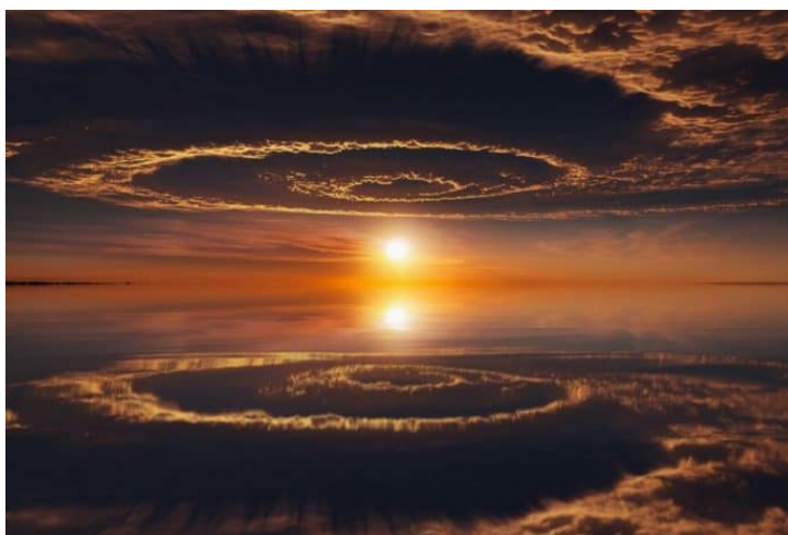
Figura 2: Leyenda de la figura.

El autor del artículo es responsable de verificar los derechos de autor de las imágenes que se envían como parte del artículo.