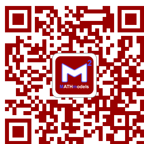
(a) 数学模型微信公众号

图片并排的需求解决方式多种多样，下面用 minipage 环境来展示一个简单的例子。注意，以下例子用到了 subcaption 命令，需要加载 subcaption 宏包。这相当于整体是一