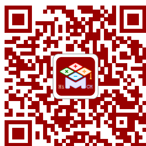
(b) HiMCM 微信公众号