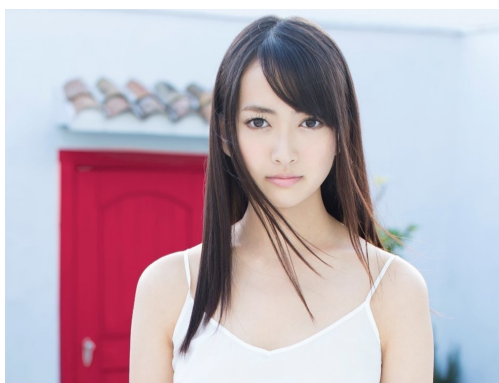
图 5-1 一个纯洁漂亮的女孩子

下面是一个插图的示例代码。注意 figure 环境是一个浮动体环境，图片的最终位置