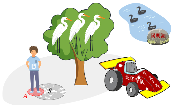
图 5-3 鸟屎区域和人在地面投影区域的定义

张大图片，大图片引用是 5-2，子图引用别分是 5-2(a)、5-2(b)、5-2(c)。当然，你也可以将两个独立的图片并排，并分别编号，具体如图 5-3 和 5-4，这两张图来源于周老师的公众号文章：被“天屎”击中的概率有多大？ [1] 。