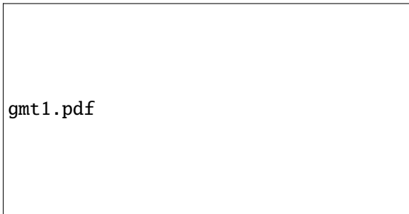
FIGURE 3 – Comme la Fig 1, mais en draft.