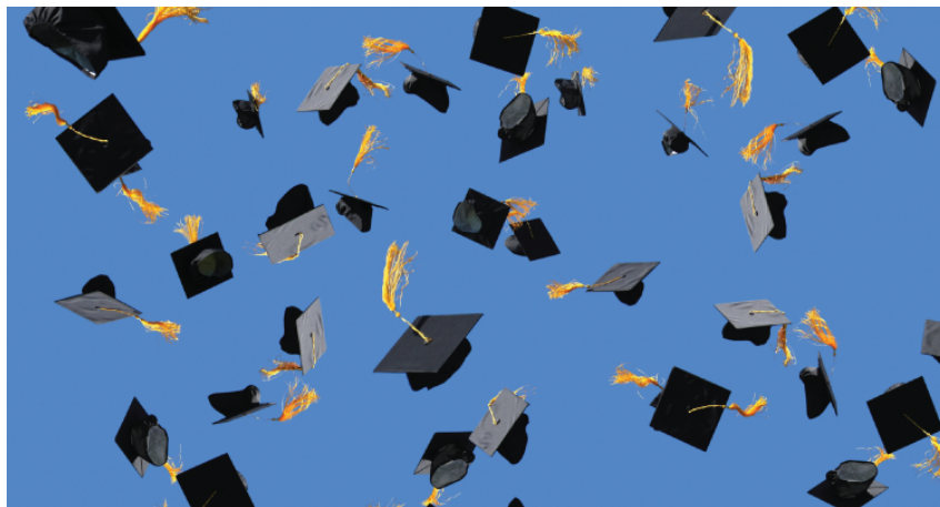
Figura 1 – Mãe, eu formei!

Lorem ipsum dolor sit amet, consectetur adipiscing elit. Aenean commodo ligula eget dolor. Aenean massa. Cum sociis natoque penatibus et magnis dis parturient montes, nascetur ridiculus mus. Donec quam felis, ultricies nec, pellentesque eu, pretium quis, sem. Nulla consequat massa quis enim. Donec pede justo, fringilla vel, aliquet nec, vulputate eget, arcu. In enim justo, rhoncus ut, imperdiet a, venenatis vitae, justo. Nullam dictum felis eu pede mollis pretium.