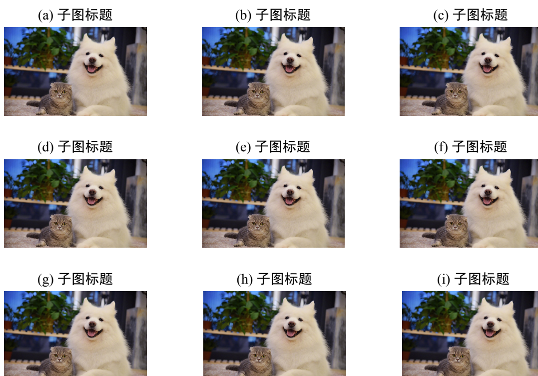
图 2-3 多行多子图