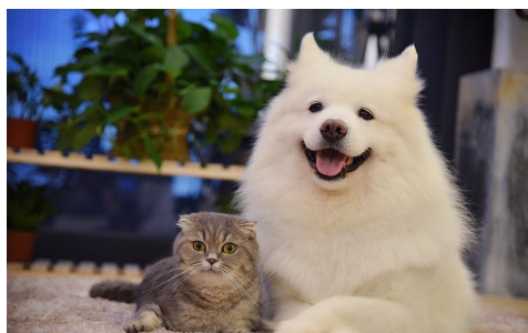
图 2-1 插入一副图