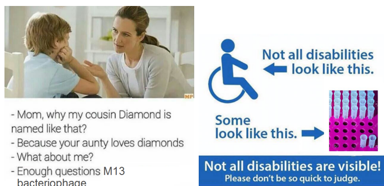
FIGURE 1.2 – . Description of the two figures.

Here is the composite, with one caption, figure 1.2.