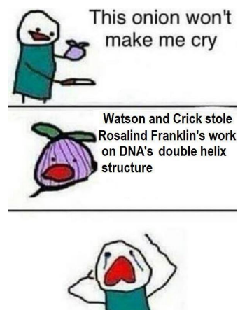
FIGURE 1.1 – . Description of the figure.

Here is the composite, with one caption, figure 1.2.